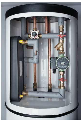
A beltéri modul belseje

A nagy teljesítményű ESB-7 berendezés az ESB-EP elektromos kazánhoz, illetve átalakítás után az adott kazánhoz kapcsolható. Az ESB-7 minden vizes fűtési rendszerhez egyszerűen csatlakoztatható!