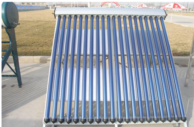
Formatervezett alumínium keret és gyűjtő