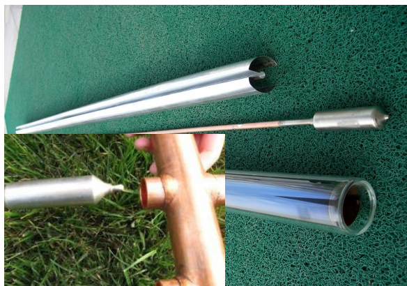
Megnövelt méretű nikkelezett heat-pipe